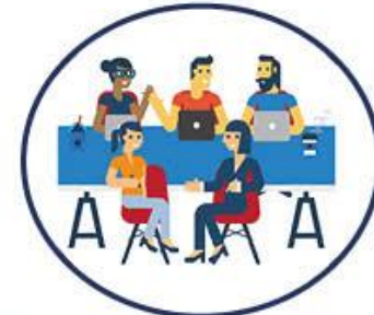
Omställningsworkshop - Utförs på myndigheten