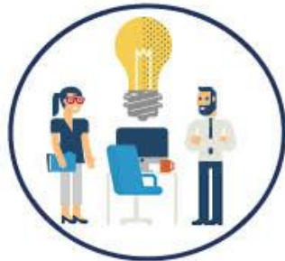
Kunskapsöversikt och rapporter