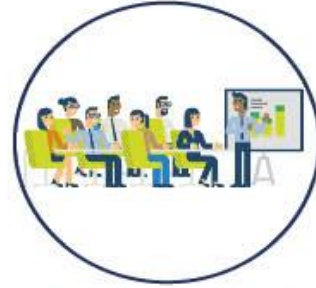
Seminarium och erfarenhetsutbyten