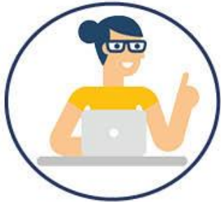
Webbplats Kunskap och inspiration

Trygghetsstiftelsen – En plattform för lokala parter att diskutera omställning och lokala omställningsmedel.